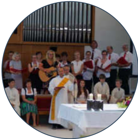
Ich war da.bei - Das war los in den letzten Monaten. S. 9