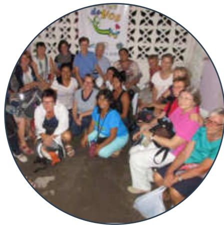
Der Solidaritätsfonds konnte 5 Projekte mit insgesamt 8000€ unterstützen! Berichte zu den ersten 3 Projekten S. 13